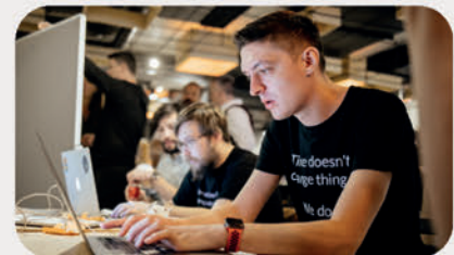
Workshop de inovație QUALITANCE